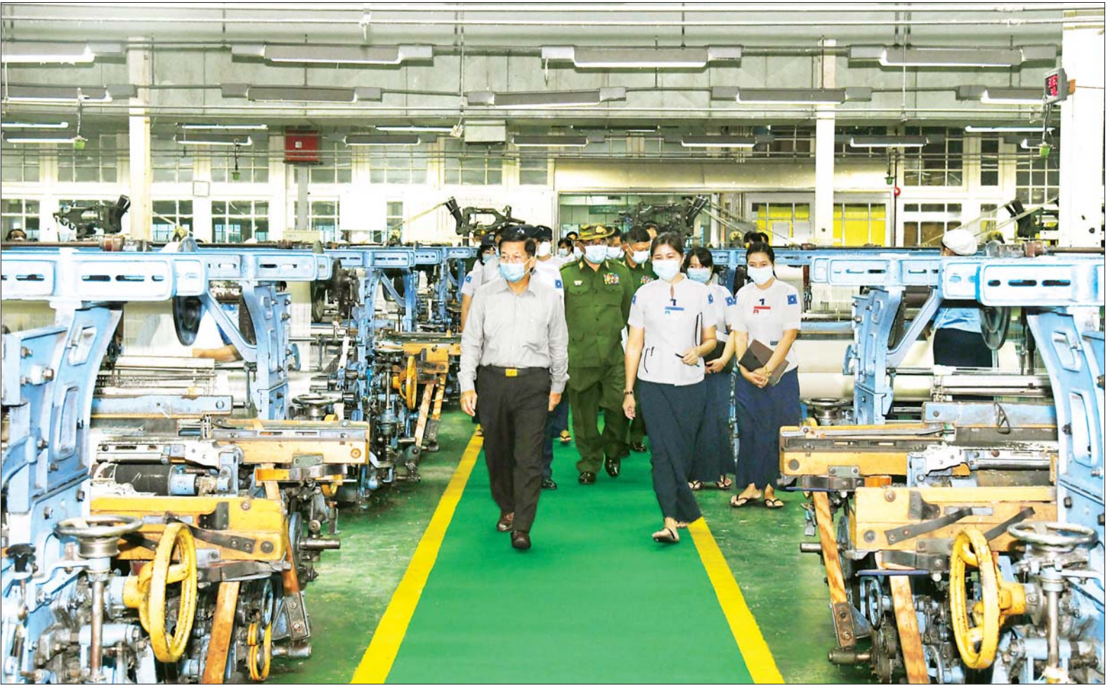
နိုင်ငံတော်စီမံအုပ်ချုပ်ရေးကောင်စီ ဥက္ကဋ္ဌ၊ နိုင်ငံတော်ဝန်ကြီးချုပ် ဗိုလ်ချုပ်မှူးကြီး မင်းအောင်လှိုင် တပ်မတော် ချည်မျှင်နှင့် အထည်စက်ရုံ (သမိုင်း) အတွင်း ကြည့်ရှုစစ်ဆေးစဉ်။

ဦးစွာ နိုင်ငံတော်စီမံအုပ်ချုပ်ရေးကောင်စီ ဥက္ကဋ္ဌ၊ နိုင်ငံတော်ဝန်ကြီးချုပ်အား တပ်မတော်ချည်မျှင်နှင့် အထည်စက်ရုံ (သမိုင်း) စက်ရုံ အစည်းအဝေး စာမျက်နှာ ၃ ကော်လံ ၁ ။