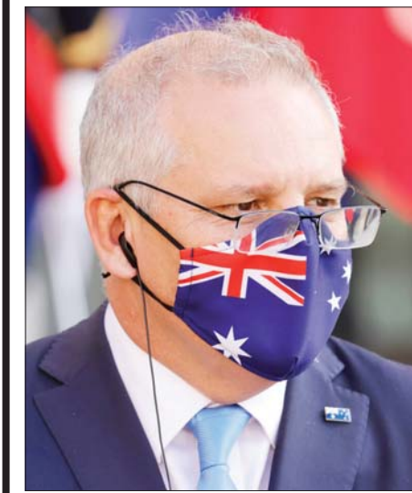
ဩစတြေးလျဝန်ကြီးချုပ် စကော့မော်ရစ်ဆင်

ကင်ဘာရာ၊ နိုဝင်ဘာ ၁၁ ဩစတြေးလျနိုင်ငံသည် ကမ္ဘာကြီးသို့ တဖြည်းဖြည်း ပြန်လည်လမ်းဖွင့်လာမှုနှင့်အတူ ဂျပန်နှင့် တောင်ကိုရီးယားနိုင်ငံတို့နှင့် ခရီးသွားအစီအစဉ်တစ်ခုကို စတင်ရန် စီစဉ်လိုက်ကြောင်း ဩစတြေးလျ ဝန်ကြီးချုပ် စကော့မော်ရစ်ဆင်က ပြောကြားခဲ့သည်။ ၁၈ လကျော်ကြာ ရပ်ဆိုင်းခဲ့ပြီးနောက် ဩစတြေးလျနှင့် အာရှနှစ်နိုင်ငံကြား ကွာရှောင်ကင်းကင်းလွတ်ခရီးသွားလာခြင်းကို မကြာမီပြန်လည် စတင်တော့မည်ဖြစ်ကြောင်း ဗစ်တိုးရီးယား ကုန်သည်ကြီးများနှင့် စက်မှုလက်မှုလုပ်ငန်းရှင်များကို မော်ရစ်ဆင်က မကြာသေးမီတွင် ပြောကြားလိုက်သည်။ တနင်္လာနေ့မှစကာ ကိုဗစ်-၁၉ ကာကွယ်ဆေး အပြည့်အဝထိုးနှံပြီးသူ ဩစတြေးလျနိုင်ငံသား