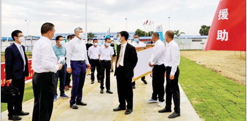
စက်ပစ္စည်းများ အပြင် ခင်ရတနာ

မြေဧရိယာ စတုရန်းမီတာ ရှစ်သောင်းရှိပြီး အဆောက်အအုံ ဧရိယာသည် စတုရန်းမီတာ တစ်သောင်းရှစ်ထောင်ရှိကာ CDC အဆောင်၊ လေ့ကျင့်ရေးသင်တန်း ကျောင်းအဆောင်၊ အုပ်ချုပ်ရေးရုံး အဆောင်၊ ပြင်ပဆောက်လုပ်ရေး လုပ်ငန်းတို့ပါဝင်ပြီး လက်တွေ့ စမ်းသပ်ခန်း စက်ပစ္စည်းများ တွဲဖက်တပ်ဆင်ထားကာ မြန်မာ နိုင်ငံ၏ ပထမဆုံး အမျိုးသားဇီဝ ဘေးကင်းမှု အဆင့်သုံး (P3) လက်တွေ့စမ်းသပ်ခန်းဖြစ်သည်။ မြန်မာနိုင်ငံဆိုင်ရာ တရုတ် သံအမတ်ကြီး Mr. Chen Hai က နိုဝင်ဘာ ၁၀ ရက်တွင် နေပြည် တော်သို့ သွားရောက်လေ့လာ ခဲ့သည်။