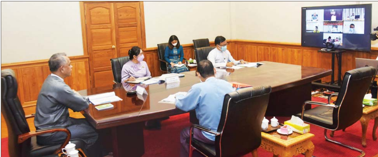
ပြည်ထောင်စုဝန်ကြီး ဦးအောင်နိုင်ဦး ကိုဗစ်-၁၉ ကြောင့် ဖြစ်ပေါ်လာနိုင်သည့် စီးပွားရေးသက်ရောက်မှုများအပေါ် ကုစားရေးလုပ်ငန်း ကော်မတီ၏ အစည်းအဝေးအမှတ်စဉ် (၈/၂၀၂၁) သို့ ဗီဒီယိုကွန်ဖရင့်စနစ်ဖြင့် တက်ရောက်စဉ်။

နေပြည်တော် နိုဝင်ဘာ ၁၁ ကိုဗစ်-၁၉ ကြောင့် ဖြစ်ပေါ်လာ နိုင်သည့် စီးပွားရေးသက်ရောက်မှု များအပေါ် ကုစားရေးလုပ်ငန်း ကော်မတီ၏ အစည်းအဝေး အမှတ်စဉ် (၈/၂၀၂၁) ကို ယနေ့ မွန်းလွဲပိုင်းတွင် ရင်းနှီးမြှုပ်နှံမှုနှင့် နိုင်ငံခြား စီးပွားဆက်သွယ်ရေး ဝန်ကြီးဌာန ရုံးအမှတ် (၁) ၌ ဗီဒီယိုကွန်ဖရင့်စနစ်ဖြင့် ကျင်းပ သည်။