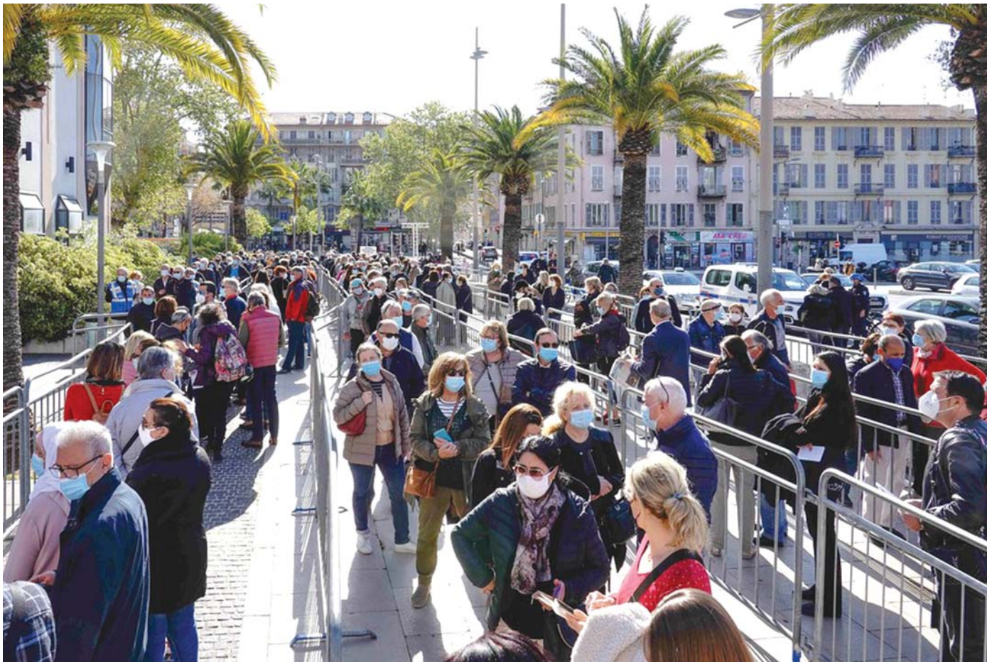
ပြင်သစ်နိုင်ငံတောင်ပိုင်း နိစ်မြို့ရှိ ကိုဗစ်-၁၉ ကာကွယ်ဆေးထိုးနေရာတွင် ကာကွယ်ဆေးထိုးရန်တန်းစီနေသော လူတန်းကြီးကိုတွေ့ရစဉ်။

ပြင်သစ်အစိုးရအကြီးအကဲက ပြင်သစ်နိုင်ငံရဲ့ ကိုဗစ်-၁၉ ဆန့်ကျင်တိုက်ဖျက်ရေးမှာ ကျန်းမာရေးကင်းလွတ်ခွင့်ရဲ့ အခန်းကဏ္ဍကို ထပ်မံအတည်ပြုပြောကြားလိုက်ပါတယ်။ လွန်ခဲ့တဲ့ ဇူလိုင်လကတည်းက အကောင်အထည်ဖော်ခဲ့တဲ့ ကျန်းမာရေးကင်းလွတ်ခွင့်နဲ့ မဟာဗျူဟာတွေကို ကျေးဇူးတင်ကြောင်းနဲ့ မိမိတို့တွေ ကိုဗစ်-၁၉ ကပ်ရောဂါကို