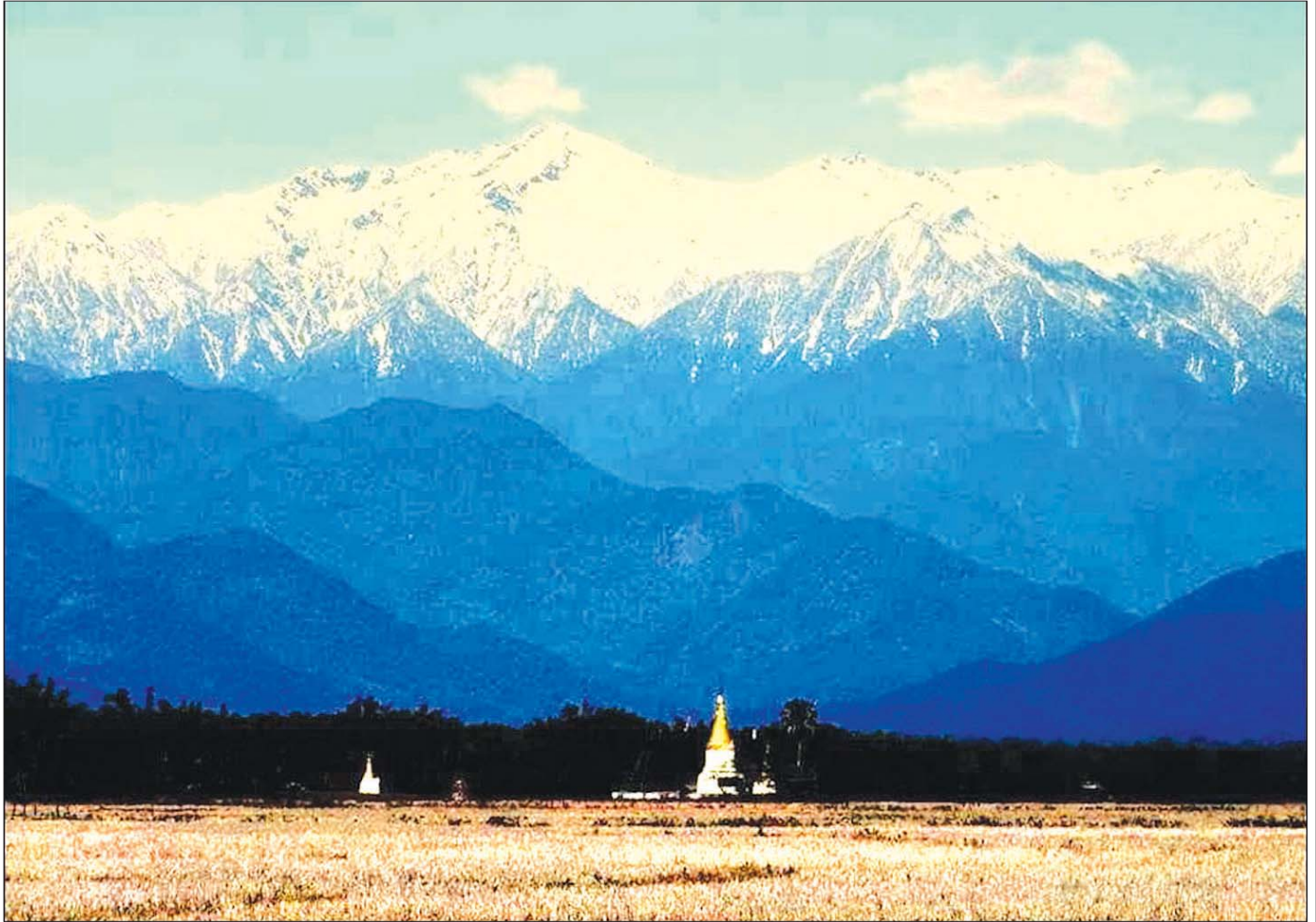
ပူတာအိုလွင်ပြင်မှ မြင်တွေ့ရသော ခါကာဘိုရာဇီ၏ အလှ

ယင်းဒဟွန်ဒမ်းမှ တောင်ဘက်သို့ ၁၁ မိုင်ခန့် ဆင်းလျှင် ထလာထု(Hta lar htu) ကျေးရွာ၊ ထို ထလာထုမှ တဆင့် - ဒဟွန်ဒမ်း (Ta shu htu- Ta zung dam) လမ်းဆုံအထိ ၁၀ မိုင် ကွာဝေးပါသည်။