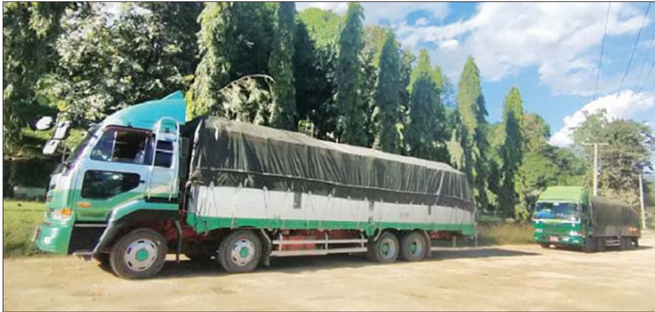
ချင်းရွှေဟော် နယ်စပ်ကုန်သွယ်ရေးစခန်းမှ ကိုဗစ်-၁၉ ရောဂါ ကာကွယ်၊ ထိန်းချုပ်၊ ကုသရေးပစ္စည်းများ တင်သွင်းလာစဉ်။

(အရည်) Bowser ယာဉ်တစ်စီးမှာ မြဝတီကုန်သွယ်ရေးဇုန်မှ ရန်ကုန်မြို့သို့ဖြစ်ပြီး Oxygen Plant တစ်ခုမှာ ရန်ကုန်မြို့သို့ဖြစ်ကြောင်း သိရသည်။ ကိုဗစ်-၁၉ ရောဂါ ကာကွယ်၊ ထိန်းချုပ်၊ ကုသရေးဆိုင်ရာပစ္စည်းများကို သက်ဆိုင်ရာဌာနများနှင့် ညှိနှိုင်းထားသည့် SOP များနှင့်အညီ ဦးစားပေး တင်သွင်းခွင့်ပြုပေးလျက်ရှိကြောင်းနှင့် ဆေးဝါးနှင့် ဆက်စပ်ပစ္စည်းများတင်သွင်းခြင်းနှင့် ဆက်စပ်သည့် အသိပေးကြေညာချက်များကိုလည်း အများပြည်သူ သိရှိစေရန် ဝန်ကြီးဌာန Website ဖြစ်သည့် commerce.gov.mm တွင် ဝင်ရောက်ကြည့်ရှုနိုင်ရေး စီစဉ်ဆောင်ရွက်ပေးထားကြောင်း သိရသည်။ သတင်းစဉ်