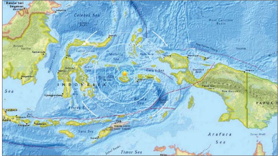
အင်ဒိုနီးရှားနိုင်ငံ အရှေ့ပိုင်းတွင် လှုပ်ခဲ့သည့် ငလျင်တစ်ခုကို ဖော်ပြသော ပုံတစ်ပုံကို တွေ့ရစဉ်။