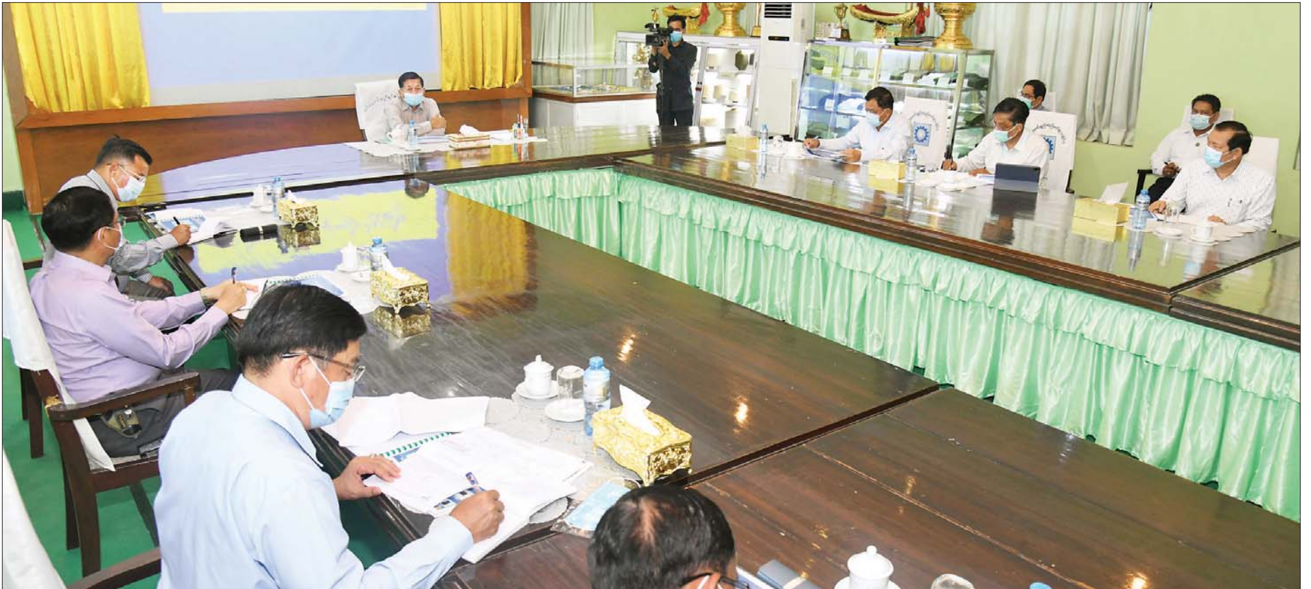
နိုင်ငံတော်စီမံအုပ်ချုပ်ရေးကောင်စီ ဥက္ကဋ္ဌ၊ နိုင်ငံတော်ဝန်ကြီးချုပ် ဗိုလ်ချုပ်မှူးကြီး မင်းအောင်လှိုင် တပ်မတော် ချည်မျှင်နှင့် အထည်စက်ရုံ (သမိုင်း) အစည်းအဝေးခန်းမတွင် တာဝန်ရှိသူများအား မှာကြားစဉ်။