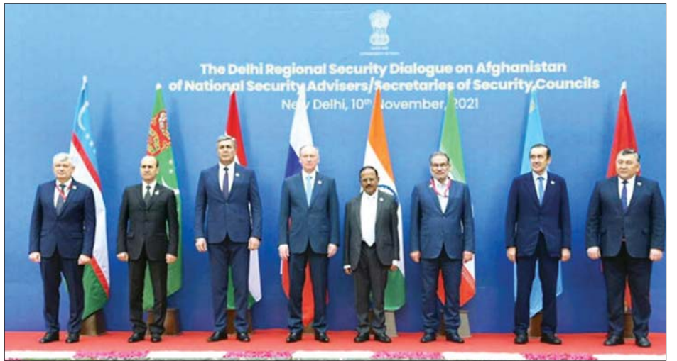
အိန္ဒိယနိုင်ငံမြို့တော် နယူးဒေလီတွင် ကျင်းပသော အာဖဂန်နစ္စတန်ဆိုင်ရာ ဒေသတွင်းလုံခြုံရေး ဆွေးနွေးဖက်စကားဝိုင်းသို့ တက်ရောက်လာသူများကို တွေ့ရစဉ်။

အကြမ်းဖက်အုပ်စုများရှိနေခြင်းနှင့် ဂိုဏ်းဂဏက္ခများ၏ အန္တရာယ်က အာဖဂန်နစ္စတန်နိုင်ငံ၏ အိမ်နီးချင်းနိုင်ငံများနှင့် တခြားဒေသတွင်း နိုင်ငံများကို ခြိမ်းခြောက်လျက်ရှိကြောင်း ၎င်းက သတိပေးထားသည်။