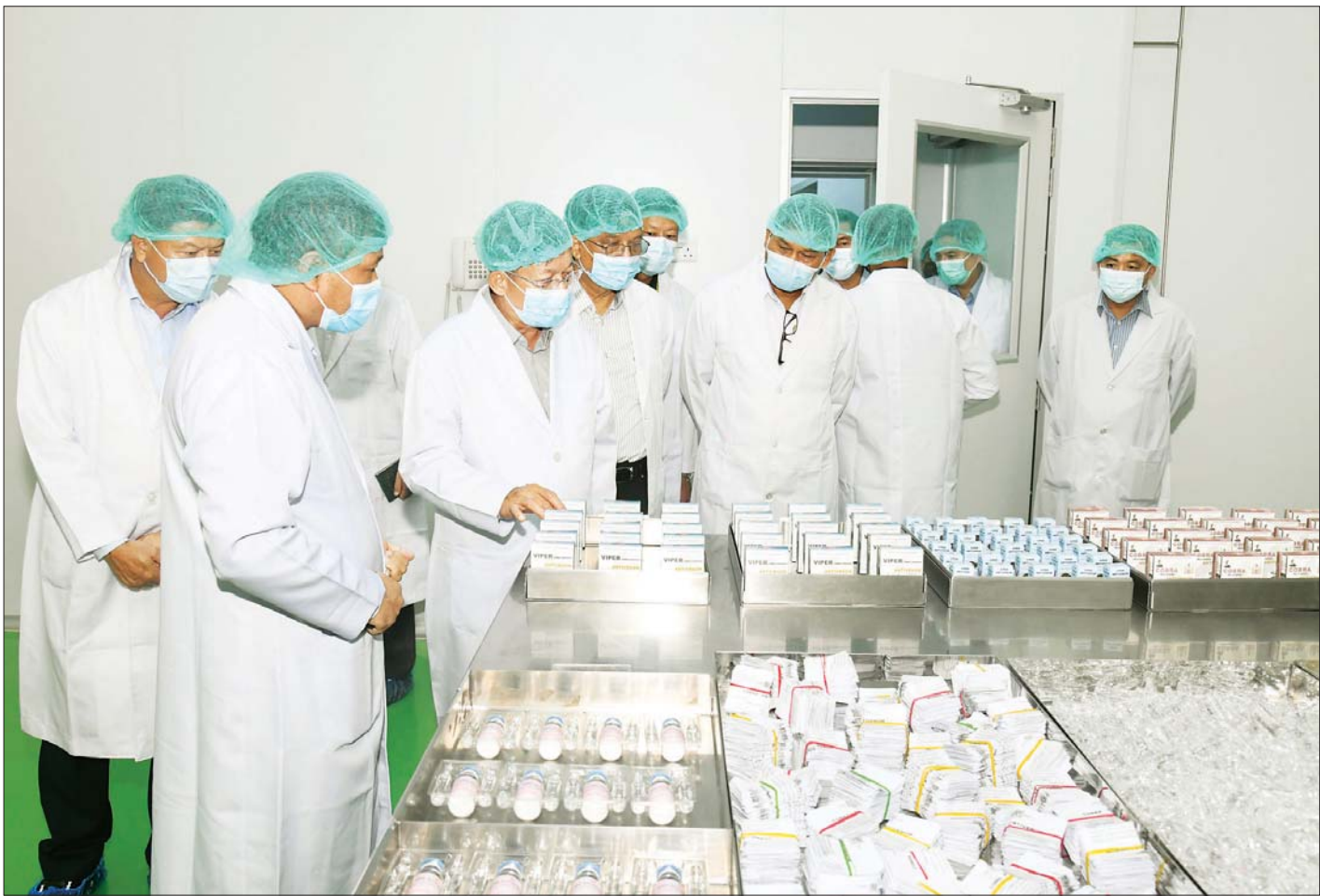
နိုင်ငံတော်စီမံအုပ်ချုပ်ရေးကောင်စီ ဥက္ကဋ္ဌ၊ နိုင်ငံတော်ဝန်ကြီးချုပ် ဗိုလ်ချုပ်မှူးကြီး မင်းအောင်လှိုင်နှင့် အဖွဲ့ဝင်များ မြန်မာ့ဆေးဝါးစက်ရုံ (အင်းစိန်) ရှိ ဆေးဝါးထုတ်လုပ်မှုဌာနအတွင်း ကြည့်ရှုစစ်ဆေးစဉ်။

မိမိတို့အနေဖြင့် တစ်နိုင်လုံး ကျန်းမာရေး စောင့်ရှောက်မှုလုပ်ငန်းများအား နိုင်ငံတော်အစိုးရမှ အပြည့်အဝ ဆောင်ရွက်ပေးနိုင်ရေးအတွက် အစီ အစဉ်ရေးဆွဲ၍ စီမံဆောင်ရွက်လျက်ရှိကြောင်း၊ ဆေးဝါးထုတ်လုပ်ရေးအတွက် ကုန်ကြမ်းများ လုံလောက်စွာရရှိရေးနှင့် စက်ရုံမှထုတ်လုပ်သည့် ဆေးဝါးများအား ဖြန့်ဖြူးနိုင်ရေး ဈေးကွက်သုတေ သနပြု ဆောင်ရွက်နေရန်လိုကြောင်း၊ မိမိတို့နိုင်ငံရှိ ပြည်သူများ၏ ကျန်းမာရေးအခြေအနေများအား သုတေသနပြုလုပ်၍ လိုအပ်သည့် ဆေးဝါးများအား